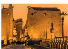
วิหารลักซอร์

** พักที่ Royal Beau Rivage Nile cruise 5* หรือเทียบเท่า **