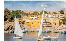
Option ล่องเรือเฟลกะ หรือ ล่องเรือชมหมู่บ้าน Nubian Village

** พักที่ Royal Beau Rivage Nile cruise 5* หรือเทียบเท่า **