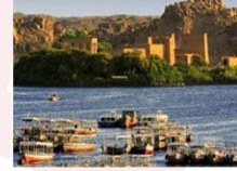
วิหารฟิเล

16.25 น. ออกเดินทางสู่กรุงไคโร สายการบิน Egypt Airlines เที่ยวบิน MS295