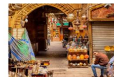
ตลาดชานเอลคาลีสี่

20.50 น. ออกเดินทางสู่อิสตันบูล เที่ยวบิน TK695