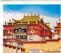
วัดชงจ้านหลิง

คุณหมิง • ยาดิง • เต๋อซิง • แซงกรีล่า 8 DAYS 7 NIGHTS