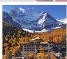
วัดชงกู่