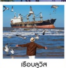
เรือลิวอิส