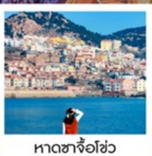
หาดซาจื่อฮั่ว