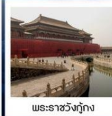
พระราชวังกุ๊กง