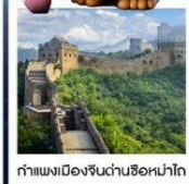
กำแพงเมืองจีนด่านซือหม่าโต