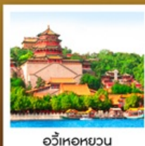
อวี่เหอหยวน

ลิ้มรสเมนูพิเศษ เปิดปักกิ่ง / สุกี่มองโกล มิซซอลิน TAO TAO JU