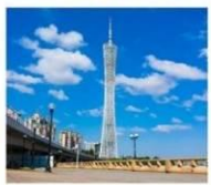
จัตุรัสฮั่วเจียง