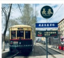
นั้รกรางดางซุน