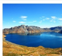
ดางไป่ซาน