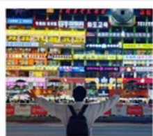
กำแพงมหาวิทยาลัยเหยียนเปียน