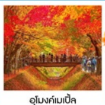
อุโมงค์เมบิซึ