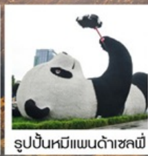
รูปปั้นหมีแพนด้าชงชิ่ง