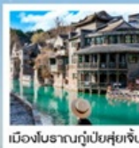
เมืองโบราณกู่เป่ย์ซู่เจิน