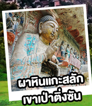
พาหิณแกะสลัก เขาป่าตึงชัน

หรือชื่อ Option : เที่ยวตัวจู้ One Day Trip