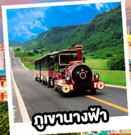
ภูเขาทางฟ้า