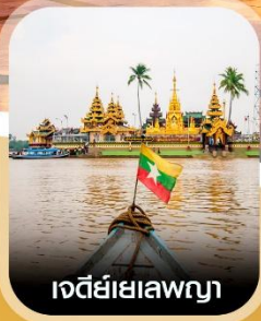
เจดีย์เยเลพญา

✈️ คอนเฟิร์ม ออกเดินทาง ทุกพีเรียด 2 ท่านขึ้นไป