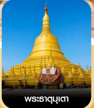
พระธาตุมุเตา