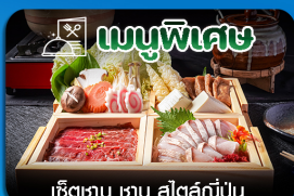
เซ็ตเมนู ซาซึ สัตสึญี่ปุ่น

ซัปโปโร-หมู่บ้านน้ำแข็ง-กระเช้าอุไร-ลานสกีซึกิไซโนะ-สวนสัตว์อาซาฮิยาม่า-โอตารุ-โรงงานช็อกโกแลต-ซ้อปปิงทานุกิโคจิ-เที้ยวเต็มไม่มีอิสระ