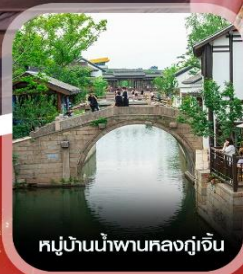
หมู่บ้านน้ำผานหลงกุเจิน