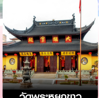
วัดพระחקขาว