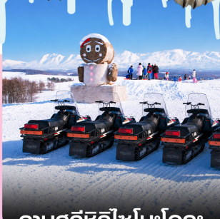
ลานสกีซึกิไซโนะโอกะ