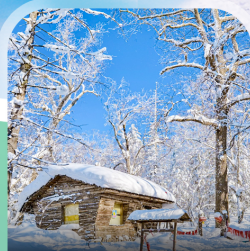
ภาพวาดสีบลี