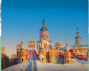
คฤหาสน์วอลก้า