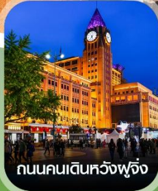
ถนนคนเดินหวังฟู่จิ่ง