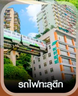
รถไฟฟ้าตุ๊ก

✈️ คอนเฟิร์มออกเดินทาง ทุกพีเรียด 2 ท่านขึ้นไป