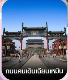
ถนนคนเดินเฉียนเหมิน

✈️ คอนเฟิร์มออกเดินทาง ทุกพีเรียด 2 ท่านขึ้นไป