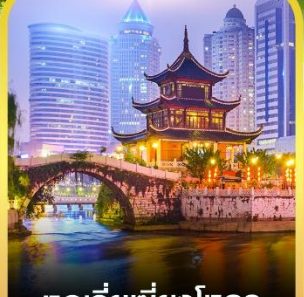
หอเจียเซียงโหลว