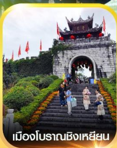
เมืองโบราณซิงเหยียน

คอนเฟิร์มออกเดินทาง ทุกพีเรียด 2 ท่านขึ้นไป