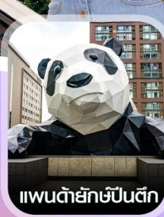
แพนด้ายักษ์ป็นตึก