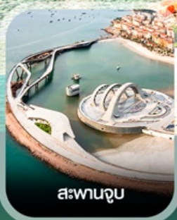
สะพานจูป