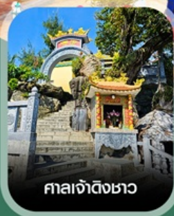
ศาลเจ้าดิ้งเซา