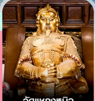
วัดแซงทมิว