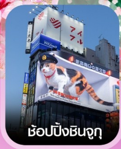
ซ้อปบิงชินจูกุ

คอนเฟิร์มออกเดินทาง ทุกพีเรียด 2 ท่านขึ้นไป