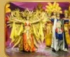
ชมการแสดงโขนชาวจีน THE GOLDEN MASK DYNASTY