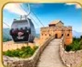
ถ่ายภาพเมืองจีน กำแพงเมืองจีน (รวมรถเช่า)