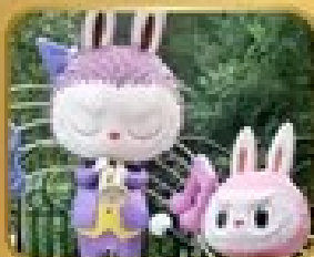
เที่ยวสวนสนุก POP LAND