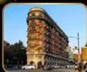
ตึกหรู เริ่มต้น WUKANG MANSION