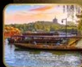
ล่องเรือ ทะเลสาบฉีหู