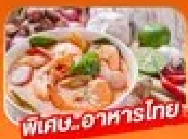
พิเศษ! อาหารไทย

1 - 5 เม.ย. / 29 เม.ย. - 3 พ.ค. 69 27 - 31 พ.ค. 69