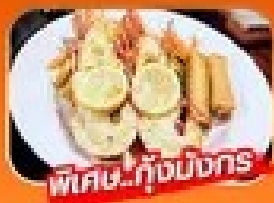
พิเศษ! กุ้งมังกร