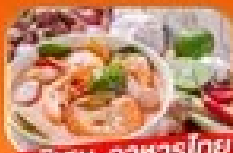
พิเศษ อาหารไทย