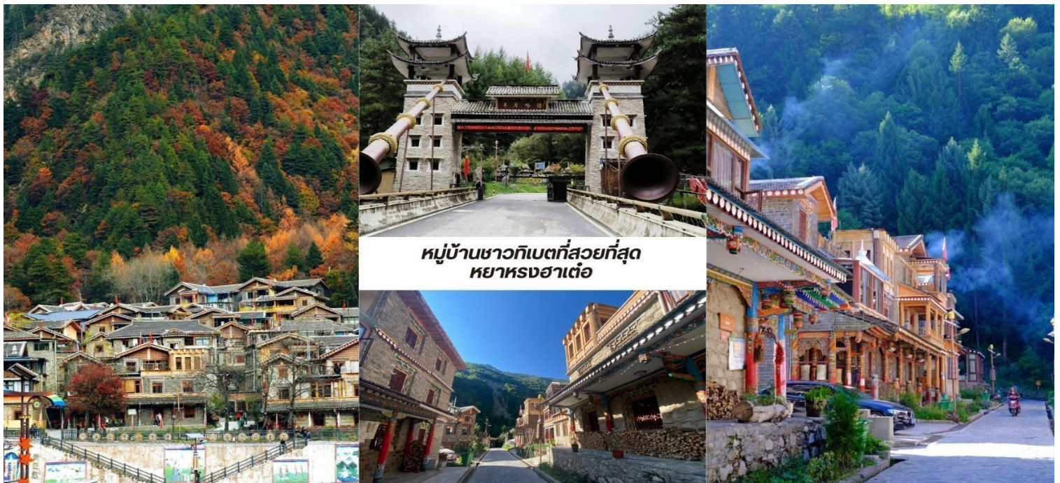
หมู่บ้านชาวทิเบตที่สวยงามที่สุด หย่าหงฮาเต๋อ

บ่าย นำท่านชม หมู่บ้านชาวทิเบตที่สวยงามที่สุด หย่าหงฮาเต๋อ (Yangrong Hades, 羊茸哈德) หมู่บ้านแห่งนี้เคยเป็นหมู่บ้านยากจนบนภูเขา แต่ด้วยการย้ายถิ่นฐานและพัฒนาการท่องเที่ยว ทำให้กลายเป็นจุดหมายปลายทางที่ดึงดูดนักท่องเที่ยวจากทั่วโลก ทัศนียภาพอันงดงาม หย่าหงฮาเต๋อล้อมรอบด้วยภูเขาสูงมีแม่น้ำเฮย์ส่วย (黑水河) ไหลผ่านและป่าไม้เขียวชอุ่มตลอดปี โดยเฉพาะในฤดูใบไม้ร่วง ป่าไม้จะเปลี่ยนเป็นสีสดใสของใบไม้เปลี่ยนสีทำให้ทั้งหมู่บ้านดูเหมือนอยู่ในภาพวาดอันงดงาม หมู่บ้านนี้ยังคงรักษาเอกลักษณ์วัฒนธรรมทิเบตดั้งเดิม ทั้งการ แต่งกาย อาหารท้องถิ่นและพิธีกรรมทางศาสนา หย่าหงฮาเต๋อ ไม่เพียงแต่เป็นสถานที่ท่องเที่ยวที่สวยงามเท่านั้น แต่ยังเป็นหมู่บ้านที่สะท้อนให้เห็นถึงการพัฒนาจากความยากจนสู่ความมั่งคั่งผ่านการผสมผสานการอนุรักษ์วัฒนธรรมดั้งเดิมกับการท่องเที่ยวได้อย่างลงตัว