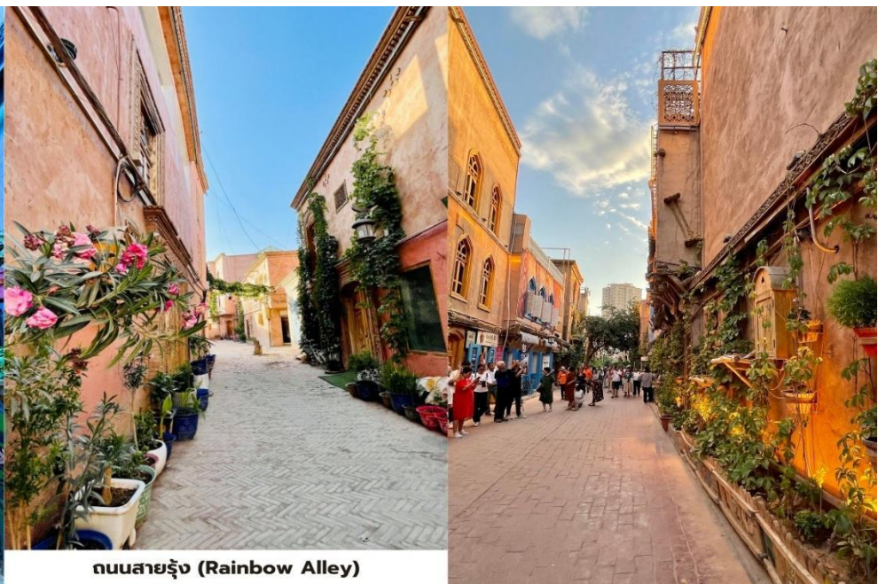
ถนนสายรุ้ง (Rainbow Alley)