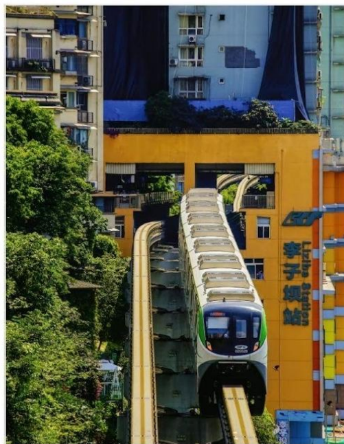
รถไฟฟ้าวิงทะเลติ๊ก