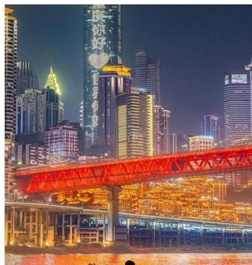
หงหย่าต้ง