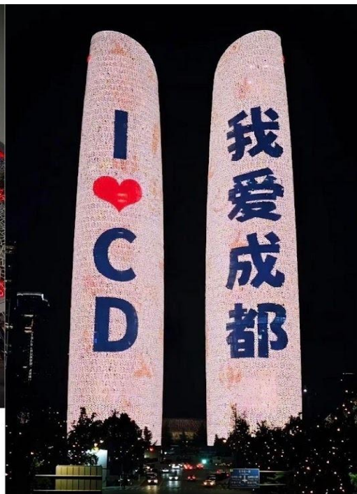
ตึกแฝดเทียนฟู่ (Tianfu International Financial Center Towers)

นำท่านเดินทางกลับสู่โรงแรมที่พัก ระหว่างทางนำท่านแวะชมแสงสีถ่ายรูปลักษณ์นอก ตึกแฝดเทียนฟู่(Tianfu International Financial Center Towers, 天府双塔) สัญลักษณ์แห่งความทันสมัยและความก้าวหน้าของเมืองเฉิงตู ตึกระฟ้าแฝดแห่งนี้ตั้งตระหง่านอยู่ใจกลางย่านการเงินแห่งใหม่ ตึกแฝดเทียนฟู่ มีความสูงกว่า 220 เมตร แต่ละตึกมีดีไซน์ที่โดดเด่นและเป็นเอกลักษณ์ โดยเฉพาะในยามค่ำคืนค่าคืน ตัวอาคารจะถูกประดับ ประดาด้วยไฟ LED ที่สว่างไสว ทำให้เกิดการแสดงแสงสีที่สวยงามตระการตา