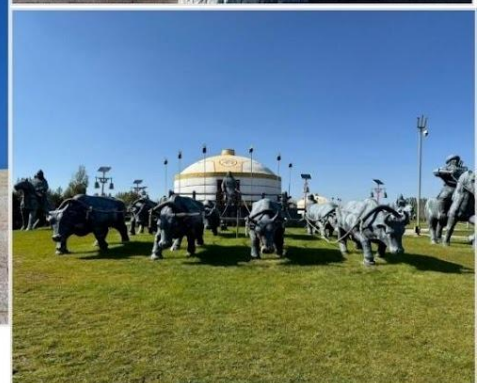
เขตท่องเที่ยวเจงกิสข่าน • กลุ่มประติมากรรม กองทัพเหล็กและกระโจมทอง