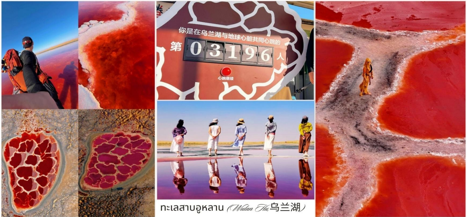
ทะเลสาบอุหลาน (Wulan Hu 乌兰湖)

หมายเหตุ : เนื่องจากสีของทะเลสาบเป็นปรากฏการณ์ทางธรรมชาติ จึงอาจมีการเปลี่ยนแปลงตามสภาพแวดล้อมในช่วงเวลาที่เดินทางจริง ทั้งนี้ ทรียังคงนำท่านสัมผัสประสบการณ์ความงดงามอันเป็นเอกลักษณ์เช่นเดิม