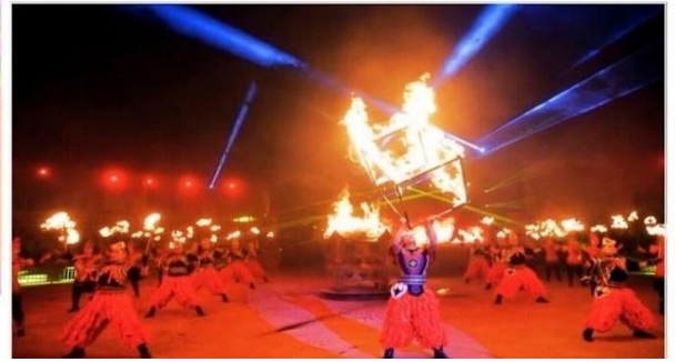
งานราตรีรอบกองไฟมองโกเลีย