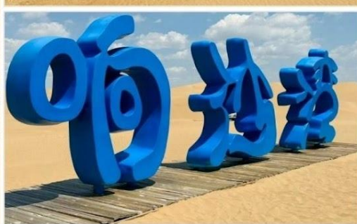
ทะเลทรายเสียงซาวาน