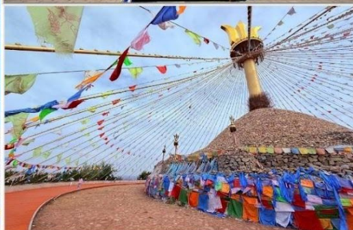
อี้เค่อโอบอ (Great Oboo, 伊克敖包)