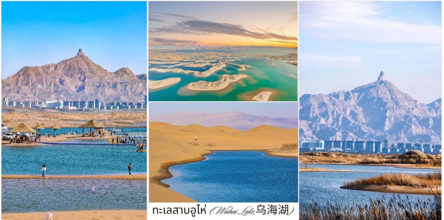
ทะเลสาบอูไห่ (Wuhai Lake, 乌海湖)

นำท่านชม วัดอากุย (A'gui Temple, 阿贵庙) มหัศจรรย์วัดทิเบตกลางหุบเขาแห่งมองโกเลียใน "สักการะศรัทธาท่ามกลางขุนเขาสูดอากาศบริสุทธิ์พร้อมสัมผัสพลังแห่งธรรมชาติ" เป็นวัดนิกายทิเบตสาย นิงมาพา (Red Sect, 红教) ที่เก่าแก่และสำคัญที่สุดแห่งหนึ่งในเขตมองโกเลียใน, ประเทศจีน สร้างขึ้นในสมัยราชวงศ์ชิง ถือเป็นศูนย์กลางแห่งจิตวิญญาณของชาวพุทธทิเบตในดินแดนกู่หล่าอันกว้างใหญ่ด้วยทำเลที่ตั้งอยู่บนภูเขาที่ระดับความสูงกว่า 1,500 เมตร ตัววัดสร้างในสไตล์ทิเบตแท้ดั้งเดิม หลังคาทองแดงประดับลวดลายมงคล ภายในประกอบด้วยพระอุโบสถใหญ่และอาคารฝั่งซ้าย-ขวา รายล้อมด้วยลานรองมณฑราหลากสีปลิวสะบัด รอบวัดมีถ้ำธรรมชาติ 5 แห่ง ที่เชื่อกันว่าเป็นที่บำเพ็ญของพระอริยสงฆ์และเทพผู้พิทักษ์ ชมสถาปัตยกรรมทิเบต พร้อมสักการะพระประธานในพระอุโบสถใหญ่, ถ่ายภาพกับรองมณฑราสีรุ้งและหุบเขาโอบล้อมวัด ซึ่งเปรียบเหมือน สัญลักษณ์แห่งการคุ้มครอง หรือขึ้นไปยังจุดชมวิวดำดอกบัวเป็นหนึ่งในจุดที่มีพลังศรัทธาและทิวทัศน์สวยงามที่สุดของพื้นที่