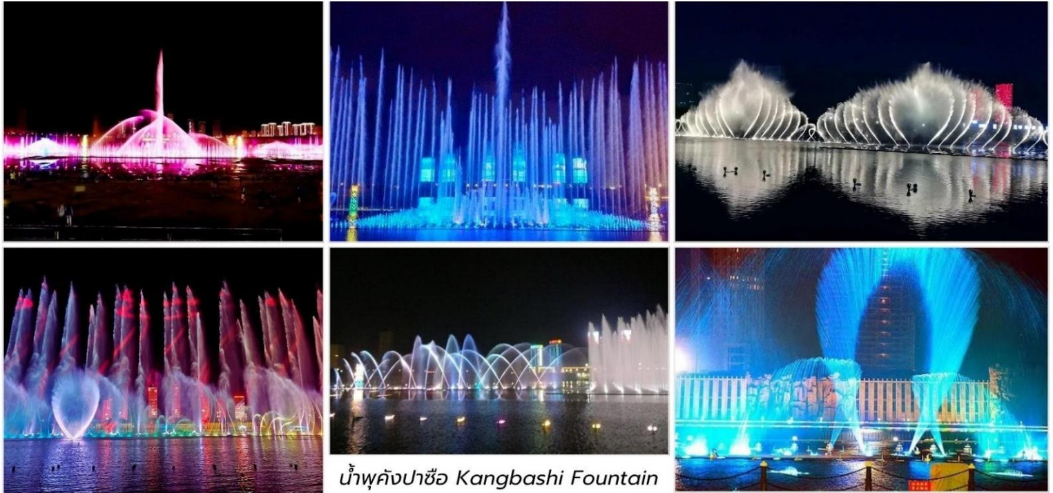
น้ำพุคังปาซือ Kangbashi Fountain