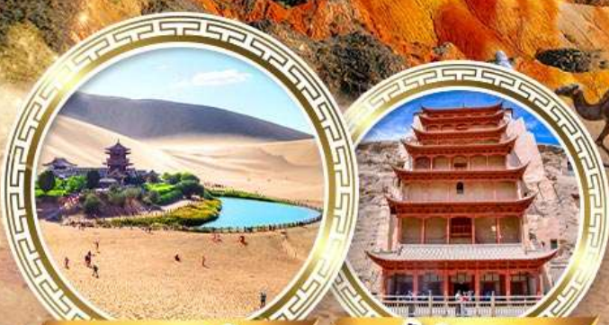
ทะเลจีนทราย