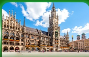
จัตุรัสมาเรียนพลาซ มิวนิค