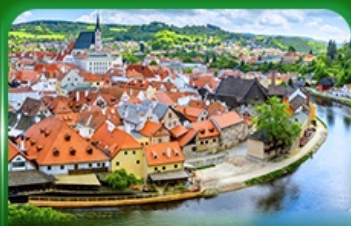
เมืองมรดกโลก เซสที่ครุมลอฟ