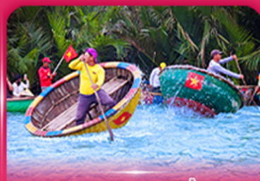
ล่องเรือกระดัง หมู่บ้านกิมทาน