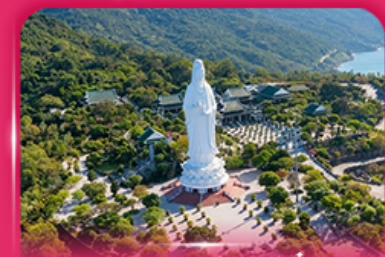
องค์กวนอิม วัดหลินอึ้ง