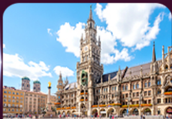
จัตุรัสมาเรียนพลัทซ์ มิวนิก