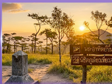
ชมพระอาทิตย์ขึ้น กุสอยดาว