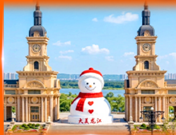
ตึกตาสหิมะยักษ์ ฮาร์บิน