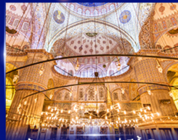
เข้าชมความงามสุเหร่าสีน้ำเงิน