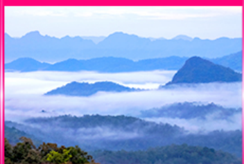
ทะเลหมอก ดอยหัวมด