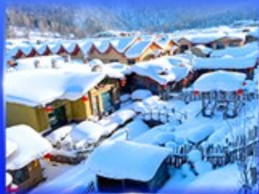
หมู่บ้านหิมะ สโนว์ทาวน์