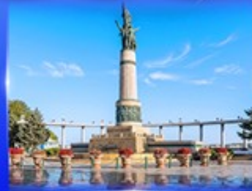
อนุสาวรีย์นิ่มพ