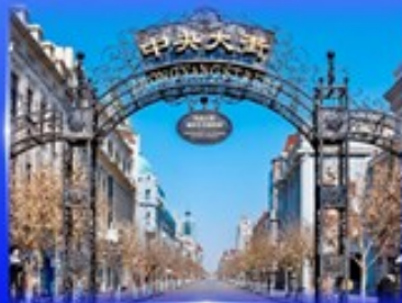
ย่านจงหยาง สตรีท