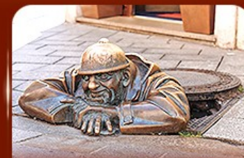
แลนด์มาร์คดัง รูปปั้นคูนิล Bratislava