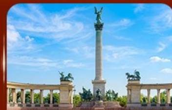
จัตุรัสวีรบุรุษ บูดาเปสต์