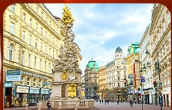
คาร์ทเทอเนอร์ สตรีท ออสเตรีย