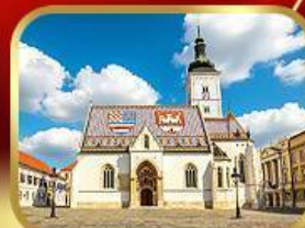
โบสถ์เซนต์มาร์ก ซาเกรบ