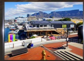
ท่าเรือ V&A waterfront