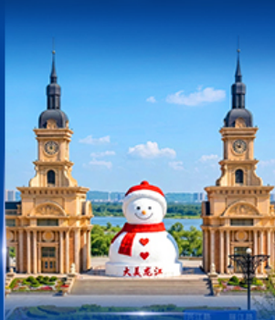
ตึกตาสหะยัทธิ ฮาร์ฮิน