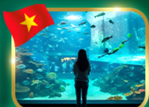
The Sea Shell Aquarium