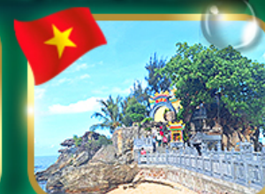
สักการะขอพรศาลเจ้ามังกร