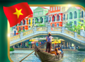
เวนิสจำลอง แกรนด์ เวลด์