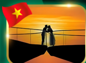
ชมอาทิตย์ตก ณ สะพานจู