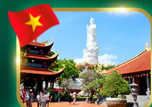
พระโพธิสัตว์กวนอิม วัดโศก๊วก