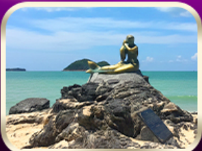
เที่ยวหาดสมิหลา สงขลา