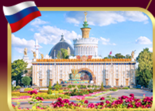
สวนสาธารณะ VDNKH