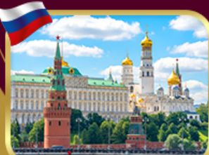
พระราชวังเครมลิน